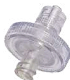
+ ISOLADOR TRANSDUTOR DE PRESSÃO