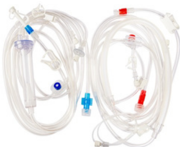
8mm - REF:71AV/00046BP

Composto por uma Linha Arterial 8mm com Entrada para Soro e Ramal de Heparina, Linha Venosa com Catabolha e Isolador de Pressão