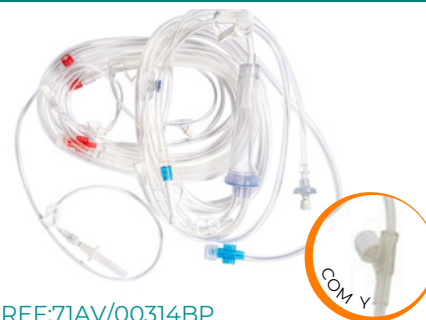
8mm - REF:71AV/00314BP

Composto por uma linha arterial 8mm sem Catabolha com Entrada para Soro, Ramal Pré Bomba para Monitorar Pressão Arterial e Ramal de Heparina, Linha Venosa com Catabolha e Isolador de Pressão