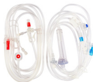
8mm - REF:71AV/00044BP

Composto por uma linha arterial 6mm com Extensão de Soro com Perfurador, Linha Venosa com Catabolha e Isolador de Pressão